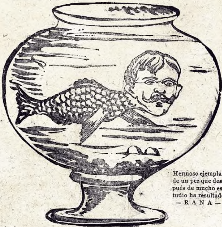
Hermoso ejemplar de un pez que después de mucho estudio ha resultado — R A N A —

* Una de las rarezas de la Exhibición son los bípedos que tiran de los carritos-sillas.