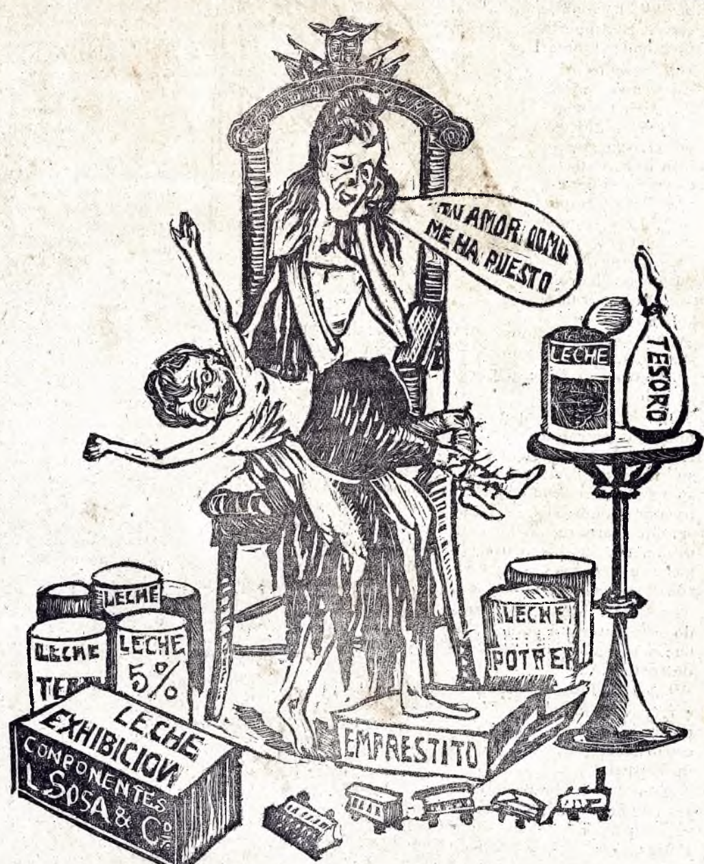
CONSECUENCIAS DE LA LACTANCIA