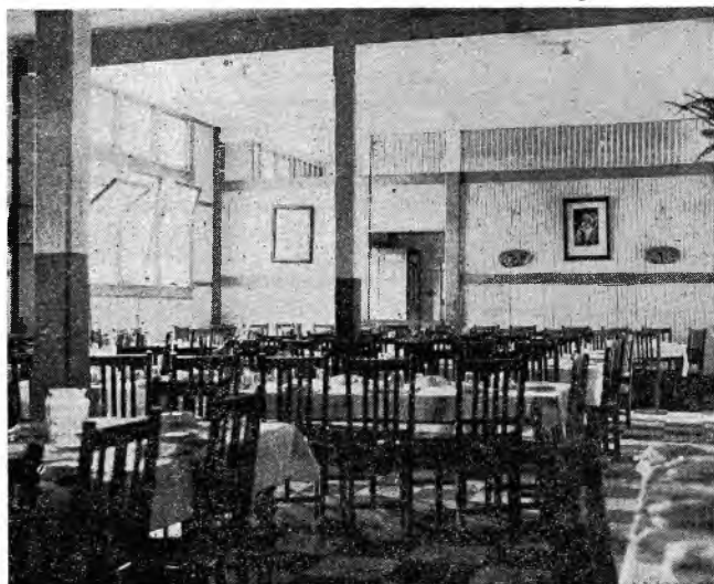
Quienes tuvieron oportunidad de asistir a la fundación de la Escuela Profesional pueden darse cuenta, por medio de esta fotografía, del increíble cambio que nuestra escuela ha experimentado con el transcurso de los años. Aquí reproducimos una parte del comedor de nuestro colegio, tal como se ve actualmente.

Por supuesto que si creemos que en la escuela se deben cultivar las labores a mano, sobre todo aquellas, que como la sombra, el punto de marca, etc., son tópicos panameños, que muchas mujeres del interior de la República hacen con toda perfección.