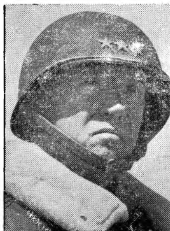
GRAL. GEORGE S. PATTON Héroe de la batalla de Francia

La muerte abre la puerta de la fama y cierra tras sí la puerta de la envidia.—Sterne.