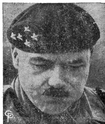
El Comandante de los franceses en Italia. El general Alphonse Juin, comandante de las tropas francesas que combaten en Italia junto con el Quinto Ejército y que rompieron recientemente la línea Gustavo.

Aunque los buenos conocen a los malos, éstos ni conocen a los buenos, ni creen que los haya en el mundo.—Fenelón.