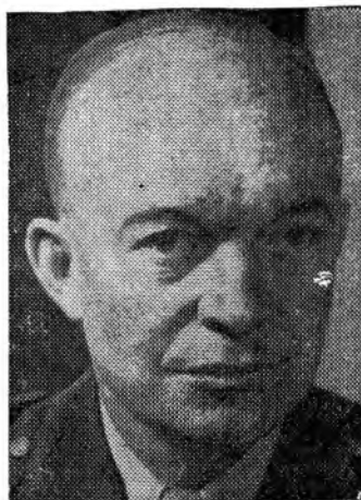
GENERAL D. EISENHOWER

Comandante supremo de las N. N. U. U. en Europa