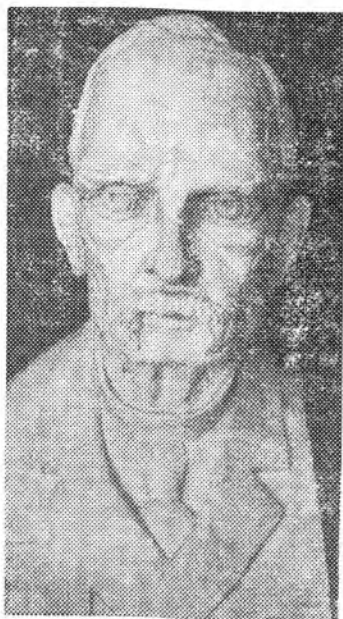
DR. JUSTO AROSEMENA