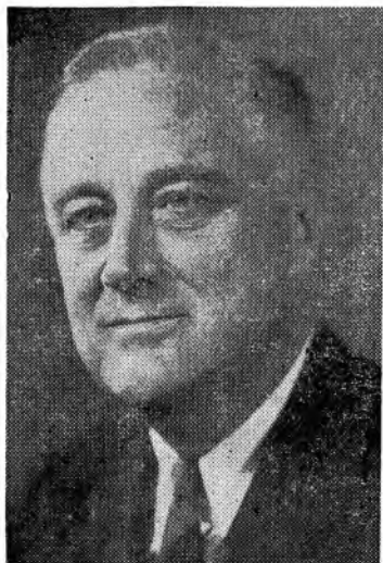
Un saludo a Franklin D. Roosevelt, paladín de la Democracia.