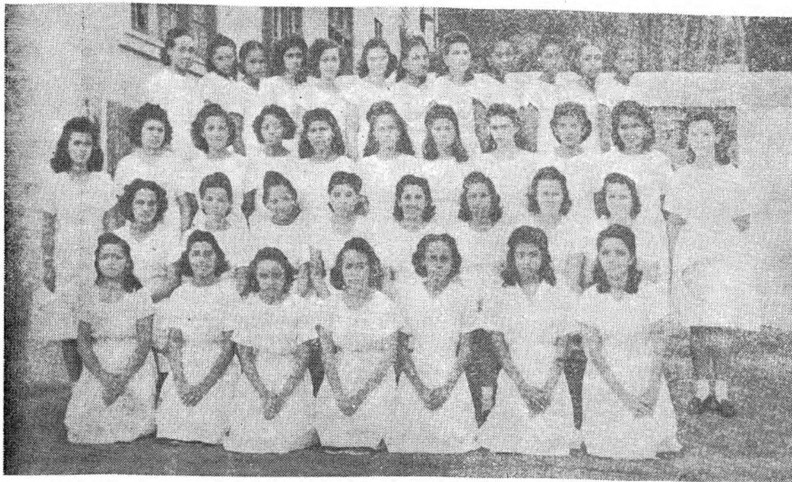
Alumnas de los Vº Años de Comercio, quienes tesoneramente luchan por levantar el nivel cultural de su escuela; fruto de dicho trabajo es la presente edición de "ALAS".