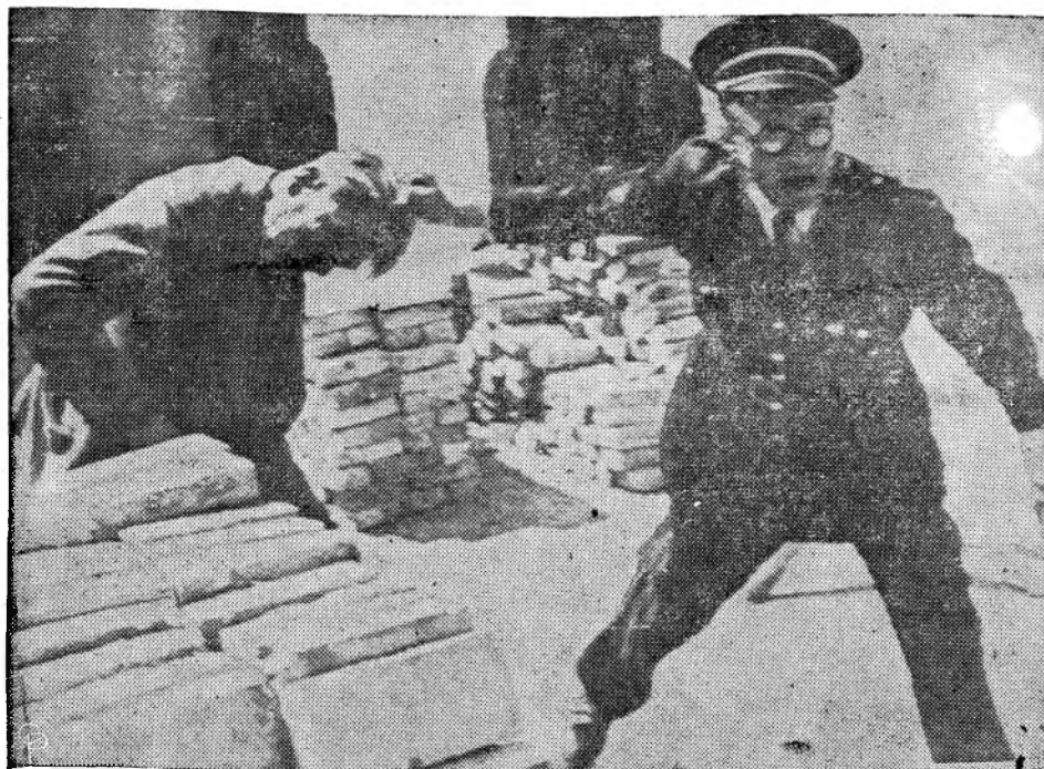
Como los franceses tratan a los colaboracionistas. Esta fotografía ilustra dramáticamente el desprecio con que los patriotas franceses tratan a los colaboracionistas. Un gendarme toma a uno de ellos por el pelo y lo arrastra prácticamente al cuartel de policía, después que los norteamericanos ocuparon la ciudad.