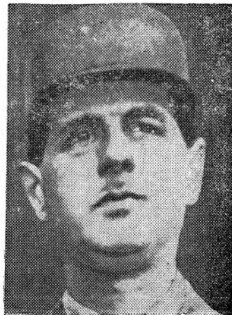
GENERAL CHARLES DE GAULLE