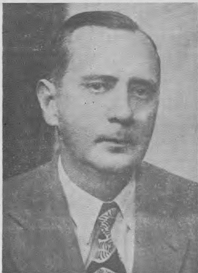
EXCMO. SR. JOSE ISAAC FABREGA Ministro de Educación