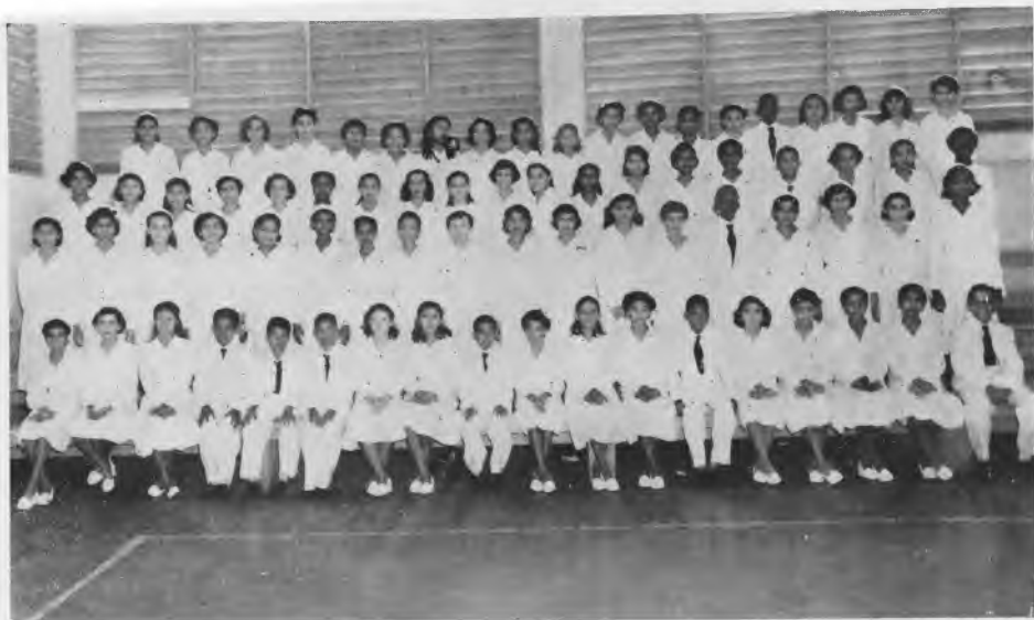
Alumnos de I Nivel