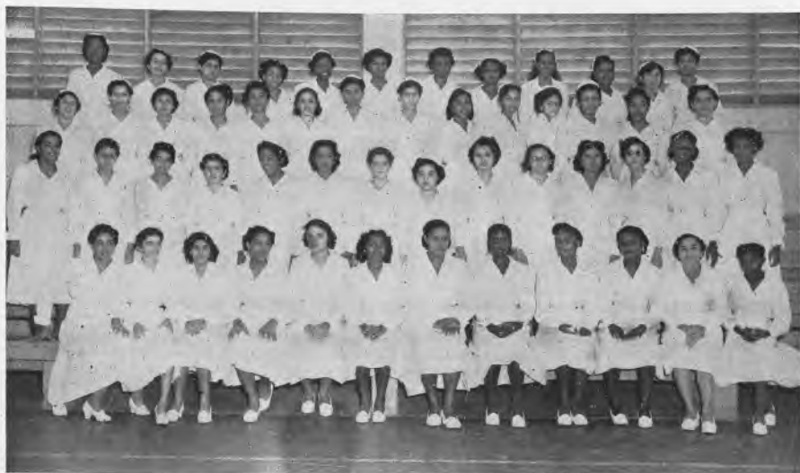
Alumnas del V Nivel de la Sección de Economía Doméstica