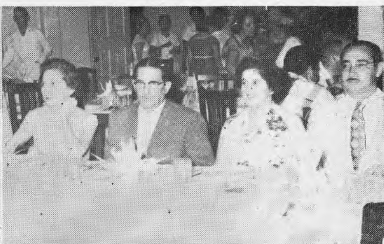
Aspectos de la Cena de la Noche Típica.