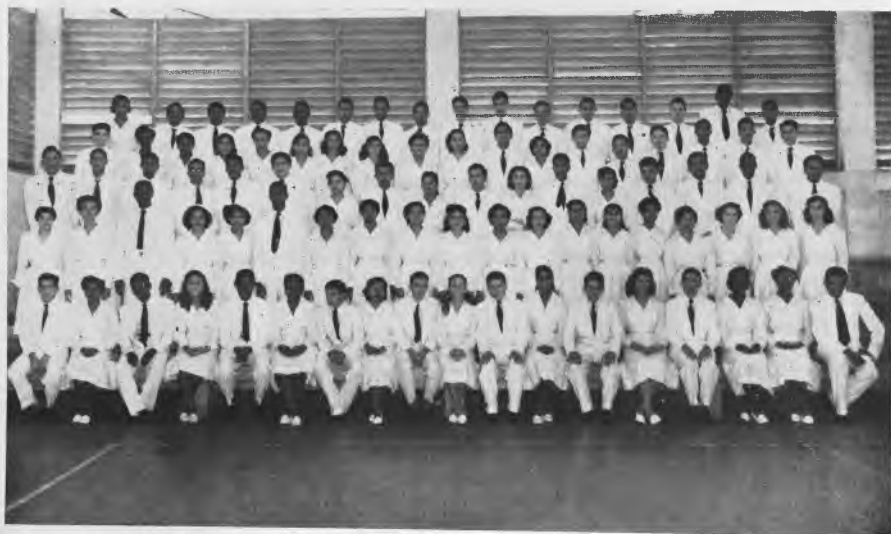
Alumnos de V Nivel de la Sección de Comercio Contabilidad