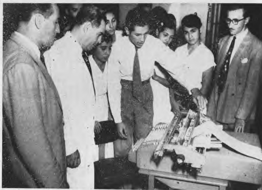
Actividad realizada por los alumnos graduandos de la sección de Comercio del año escolar 1952-53.