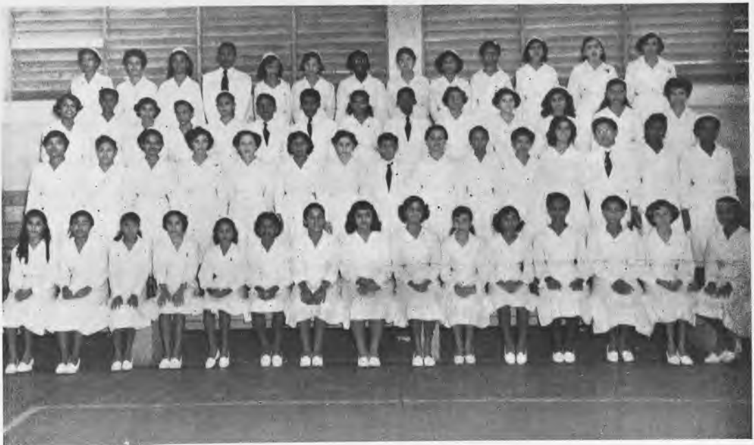
Alumnas de II Nivel