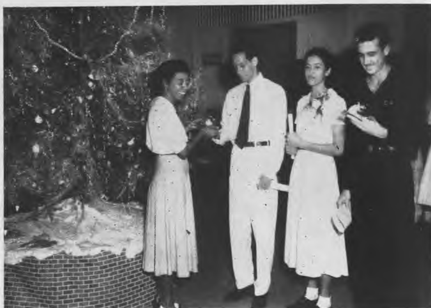
Entrega de la Rosa Blanca a los alumnos ganadores del mejor Cuento de Navidad.