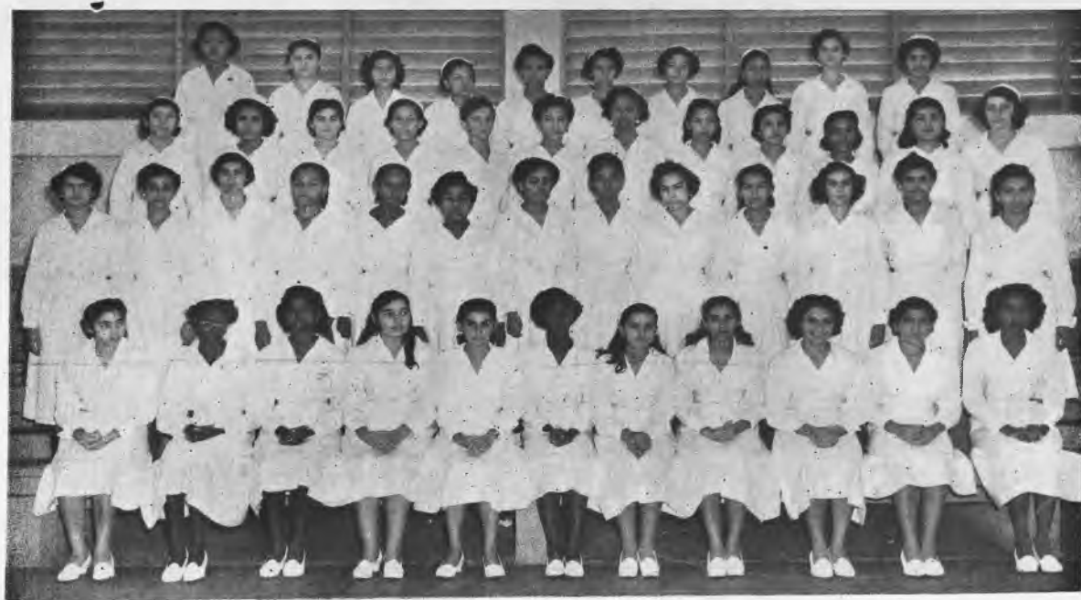
Alumnas de IV Nivel de la Sección de Economía Doméstica