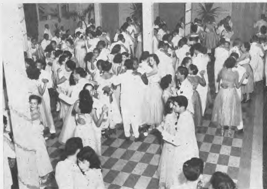
Baile de graduación de los graduandos del 1954.