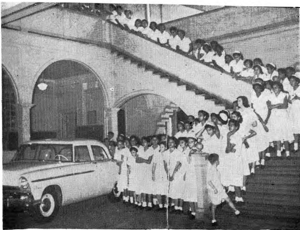
Las internas esperan entusiasmadas a la feliz ganadora del automóvil