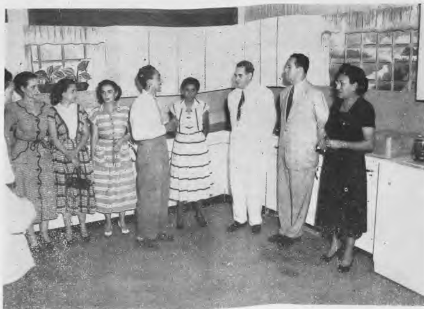
Actividad realizada por los alumnos graduandos de la Sec- ción de Comercio del año es- colar de 1952-53.