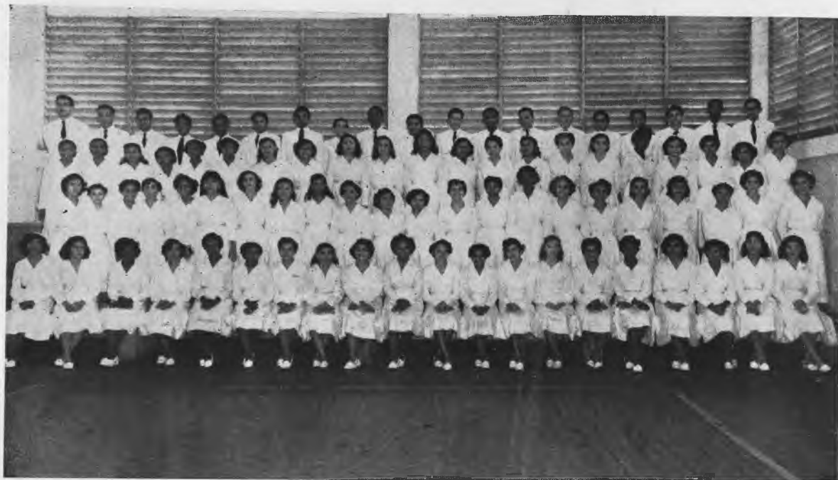
Alumnos del IV Nivel de la Sección de Comercio