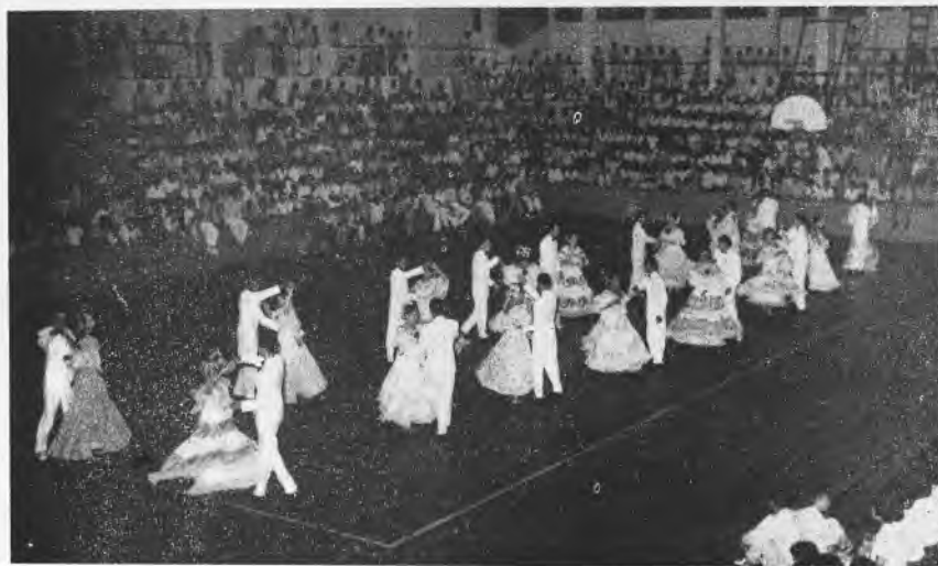
Presentación del grupo de lanceros y cuadrillas de la Escuela Profesional, en el Gimnasio Nacional.