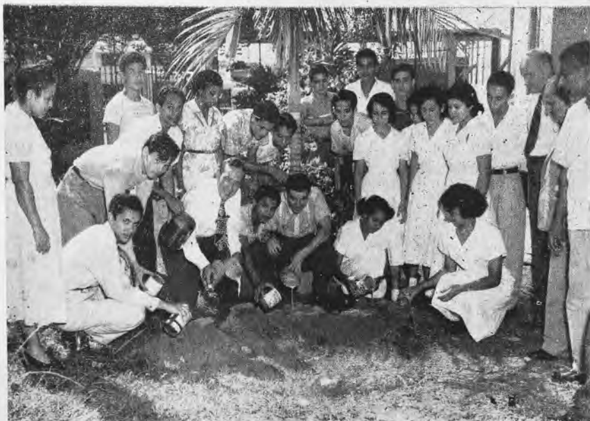
Un grupo de alumnos y profesores recibe instrucción de los técnicos del Departamento de Agricultura, de como combatir las arrieras, en la campaña pre-conservación de los jardines de la escuela.