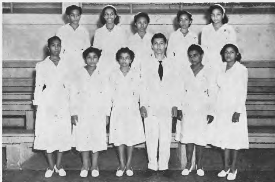
Alumnos de V Año de Telegrafía