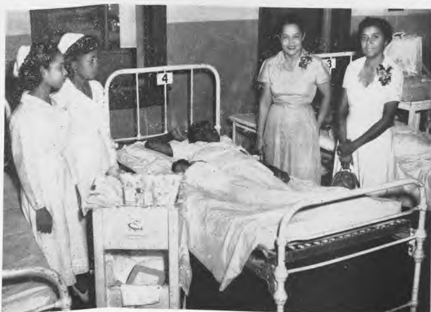
Entrega de la Canastilla que la Escuela regala todos los a- ños al primer niño que nazca el 25 de Diciembre. Actividad realizada por las alumnas de la Sección de Economía Domés- tica.