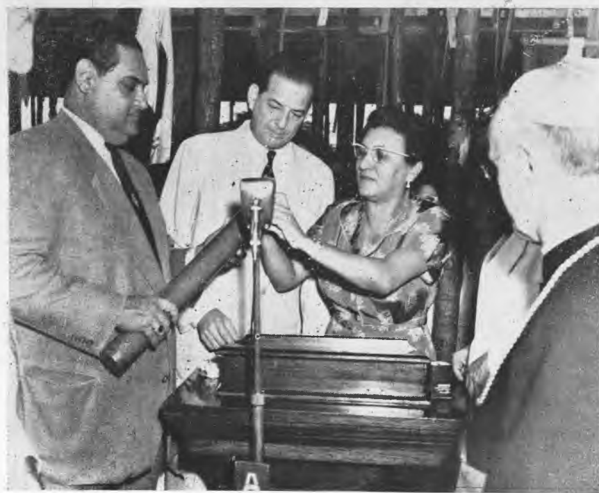
Acto de la colocación de la piedra fundamental para el nuevo edificio de la Escuela Profesional.