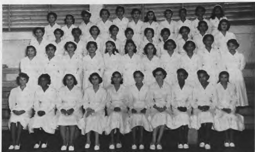
Alumnas de V Nivel de la Sección de Comercio Secretariado.