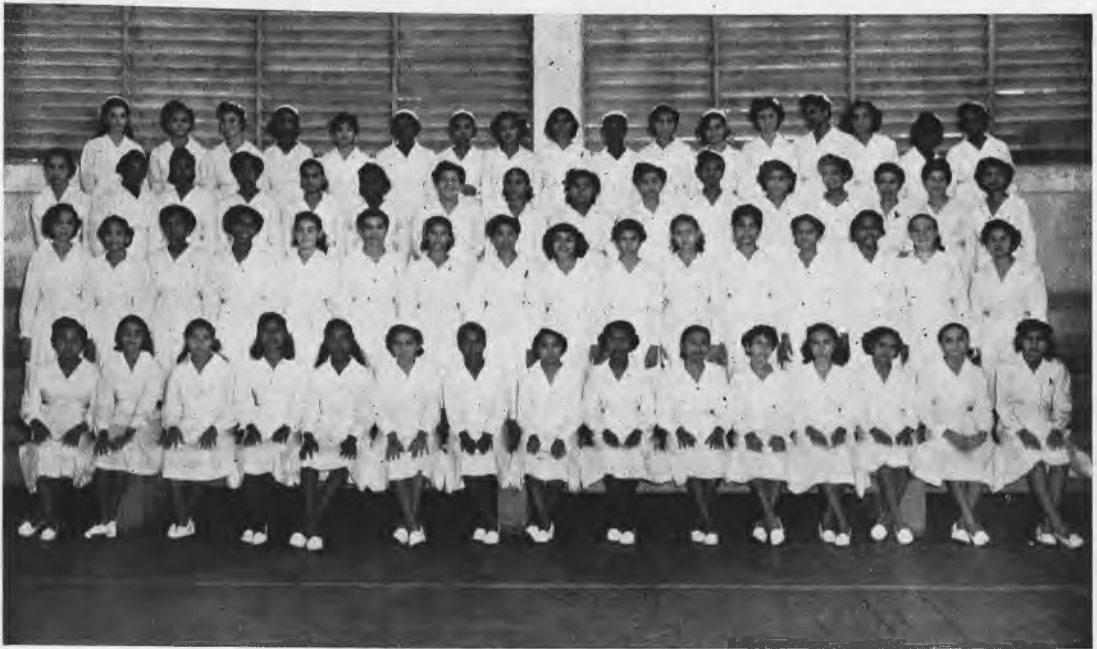
Alumnas de II Nivel