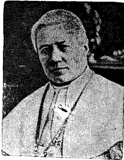
SU SANTIDAD PIO X MUERTO EL 22 DE AGOSTO DE 1914

—¿Queréis verlo? Sí. Venid conmigo.... Ya sabéis que el jefe supremo de la Iglesia católica está enfermo. ¿Qué tiene? Sufre un terrible mal. Los médicos que lo examinan diariamente, tiemblan ante el progreso de la fatalidad. Es un mal silencioso. Viene como la muerte. Sólo ata-