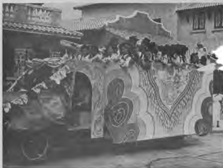
Artístico y llamativo carro alegórico del Club Social "Los Dispuestos" que obtuvo el premio de la comparsa más alegre durante los Carnavales de 1938 y que constituyó una de las notas más atractivas de dichas fiestas.

Indiscutiblemente que en la historia Carnestoléndica de Panamá pocas instituciones sociales han mantenido un prestigio tan sólido y un renombre tan merecido como el Club Social "LOS DISPUESTOS", donde siempre se ha dado