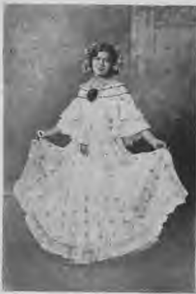
Una damita gentil luciendo el clásico atavío panameño, esa indumentaria que triunfa en el Ballet "La Evolución del Tamborito", creación del artista nacional Rene Mistell.

En medio de la penumbra, como ocurría en nuestros carnavales de antaño, se inicia este último acto con la típica "tuna", cuando al amanecer del Miércoles de Ceniza los concurrentes a los toldos los abandonaban para asistir a la iglesia a "tomar" ceniza, llevando las empolleradas en la mano una vela encendida y a los golpes del tambor y acordes de la música cantaban y bailaban en el trayecto que recorrían despidiendo a los carnavales. Así más o menos, se presentarán en este acto cuarenta muchachas (Pasa a la pág. 14)