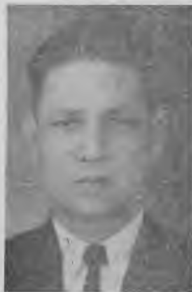
Don Ernesto Davis, inspirado poeta nacional, autor del poema "La Pollera" que ha merecido elogiosos comentarios de la crítica local y extranjera.