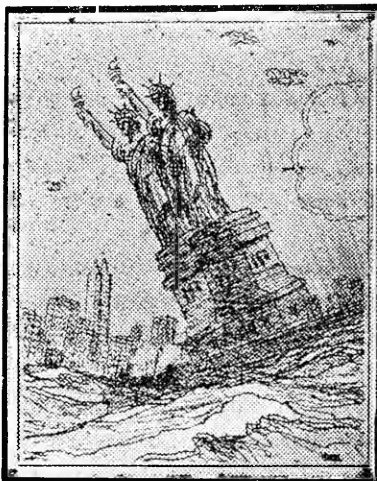
Vista del puerto de New York desde el puente de un barco en el que se respeta la Ley Seca.