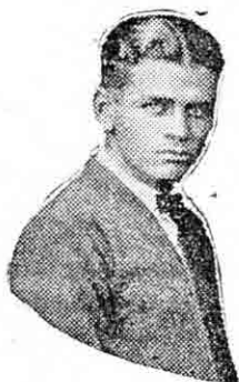
EL GRAN RAMON

Dempsey se cree capaz de resistir impasible, las embestidas feroces del temible toro pampeano , cuyos triunfos en el cuadrilátero re-