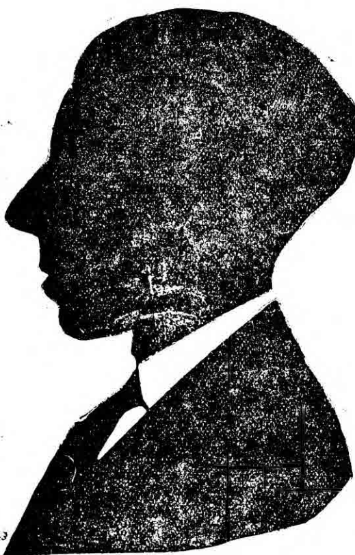
FERNANDO SOLER, celebrado artista, director de la Compañía de Comedias que lleva su nombre, que actuará en breve en Panamá.

nuestros ojos la mística N. en la hermosa ciudad del Sena.